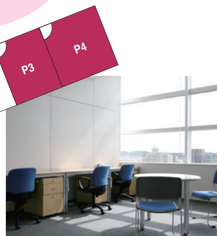
■ポストインキュベートルーム