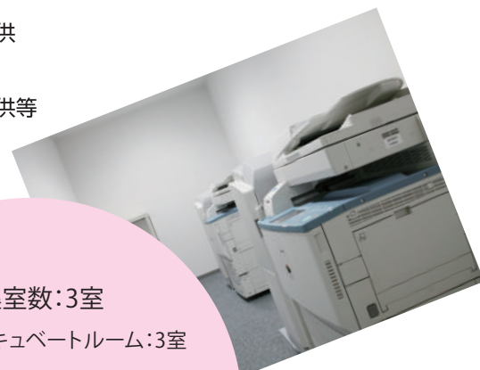
■SOHOサービスコーナー