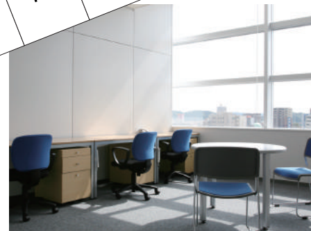
■ポストインキュベートルーム