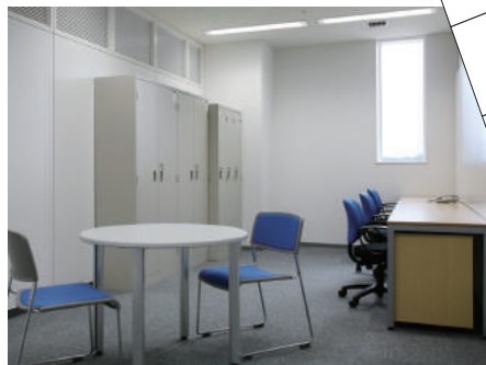
■メインインキュベートルーム