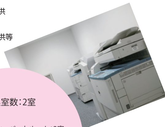
■SOHOサービスコーナー