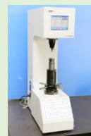
ロックウェル硬度計