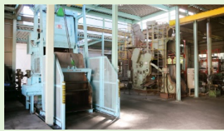
ショットブラスト