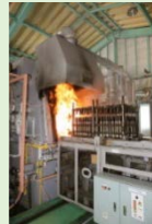
ケース型熱処理炉