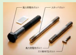
エネルギー・プラント用ボルト