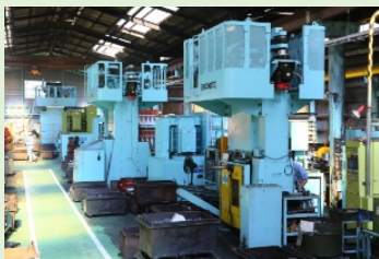
サーボモーター駆動スクリーブレス機