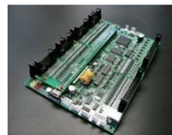
エンコーダー入力付 4軸モーターコントローラ