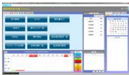
病理診断業務支援ソフトウェア (Windows 版/ブラウザ版)