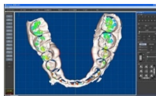
三次元噛み合わせシミュレーター