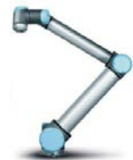
UNIVERSAL ROBOTS 応用自動機