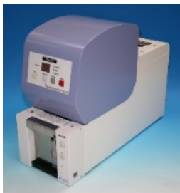
スライドプリンター (サーマル式)