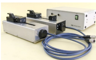
多軸シリンジポンプ送液システム